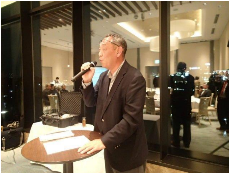
TEC 受注委員長 茂木理事が司会進行を行います。