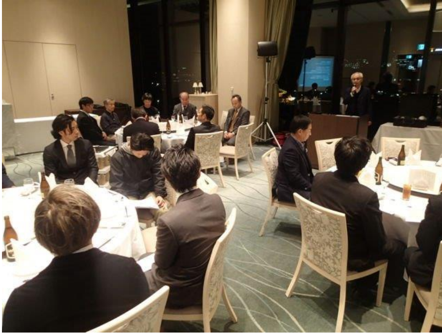
開催挨拶を行うTEC日吉理事長