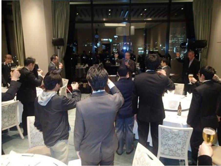
TEC 大山専務理事が乾杯の音頭をとります。