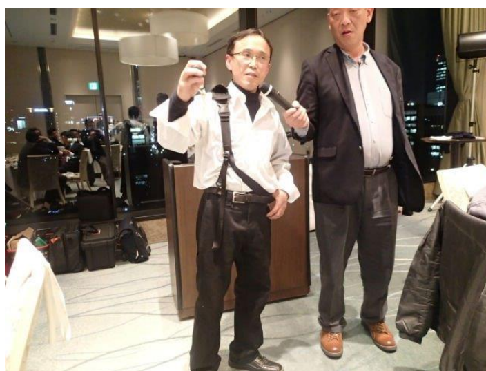
高木製作所 高木代表